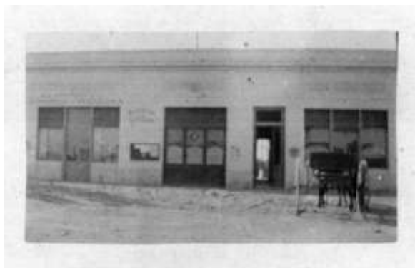
Primer edificio que ocupó la Municipalidad en Río Colorado.