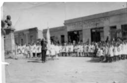
Esta plazoleta, era el lugar elegido para conmemorar las Fiestas Patrias a fines de la década del 10 y del 20.

Y así, de casa en casa, sufriendo continuos traslados hasta la construcción de su edificio propio, la Municipalidad ha ocupado los siguientes inmuebles: la mencionada frente a la estación hasta 1927, la casa de Urtizberea-Ordoqui hasta 1933 (aquí se instaló después la Biblioteca Sarmiento) y la casa de Guillermo Pérez, ex”Bar Central” hasta el 26 de setiembre de 1965 , año en que pasa a ocupar sus propias instalaciones frente a la Plaza San Martín, donde se erigieron los principales edificios públicos de la comunidad. Habían pasado más de 49 años desde su traslado !!!.