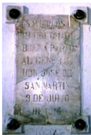
Placa colocada en 1916.

A los escasos 3 (tres) meses de instaladas las autoridades comunales, los vecinos se organizan para festejar el “Centenario de la Declaración de la Independencia”. Mudo testimonio de este acontecimiento es la placa que se coloca en el monumento al Gral San Martín, erigido en una pequeña plazoleta, frente a la estación y a la Municipalidad que dice: “ Los pueblos de Río Colorado y Buena Parada al Gral don José de San Martín. 9 de julio de 1916 ” (5)