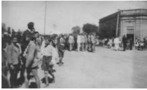
Concentración de autoridades y público frente a la Municipalidad , instalada en la esquina de Sarmiento e Irigoyen (casa Pérez). Fte. Flia Pulita

Algo semejante ha ocurrido con las demás Instituciones del pueblo: Comisaría de Policía, Correos y Telégrafos, Juzgado de Paz y Registro Civil, etc.